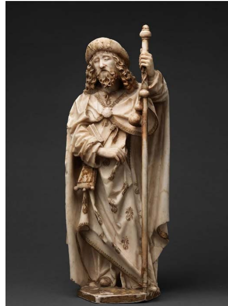
Santiago Apóstol. Obra de Gil de Siloé en alabastro para el sepulcro de Juan II de Castilla e Isabel de Portugal en la Cartuja de Miraflores (Burgos). Hoy en el Metropolitan de Nueva York

Sin ser algo exclusivo de Castilla y León, a lo largo del siglo XX especialmente sucedió un lamentable proceso de dispersión de bienes muebles e inmuebles que hoy debería formar parte del Patrimonio Cultural de Castilla y León y que, por circunstancias azarosas o planificadas, legales o ilícitas, se encuentran fuera de nuestra comunidad y de nuestro país. El catálogo es amplio y bien conocido en algunos casos, como las pinturas de San Baudelio de Berlanga (Casillas de Berlanga, Soria) depositadas en el Museo del Prado y en el Museo de los Claustros de Nueva York; el ábside románico de San Martín de Fuentidueña (Segovia), hoy en el Museo de los Claustros de Nueva York, o el claustro del monasterio de Santa María de Sacramenia (Segovia), en Miami; la sillería gótica del monasterio de La Armedilla (Cogeces del Monte, Valladolid) en el Museo de Artes Decorativas de París, o el tímpano de la portada de la iglesia de ese mismo conjunto en un museo de Kansas; obras muebles de grandes artistas medievales como el Maestro de Osma, Pedro Berruguete o el Maestro de Palanquinos, por citar unos pocos, dispersas por museos de todo el mundo; el retablo de la catedral de Ciudad Rodrigo, hoy en el Tucson Museum of Art (Arizona), etc.