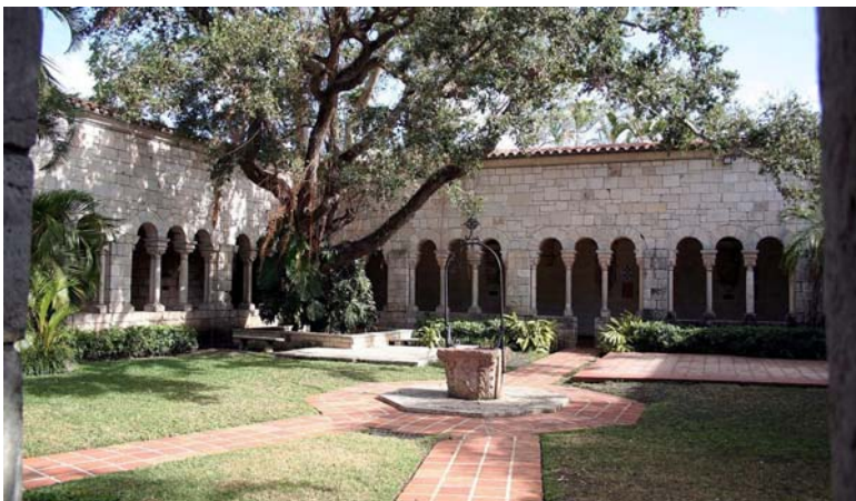
Claustro de Santa María de Sacramenia. Monastery of St. Bernard of Clairvaux Church, Miami (EEUU)